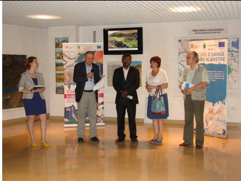
Festivitate premiere- 29 iunie 2011